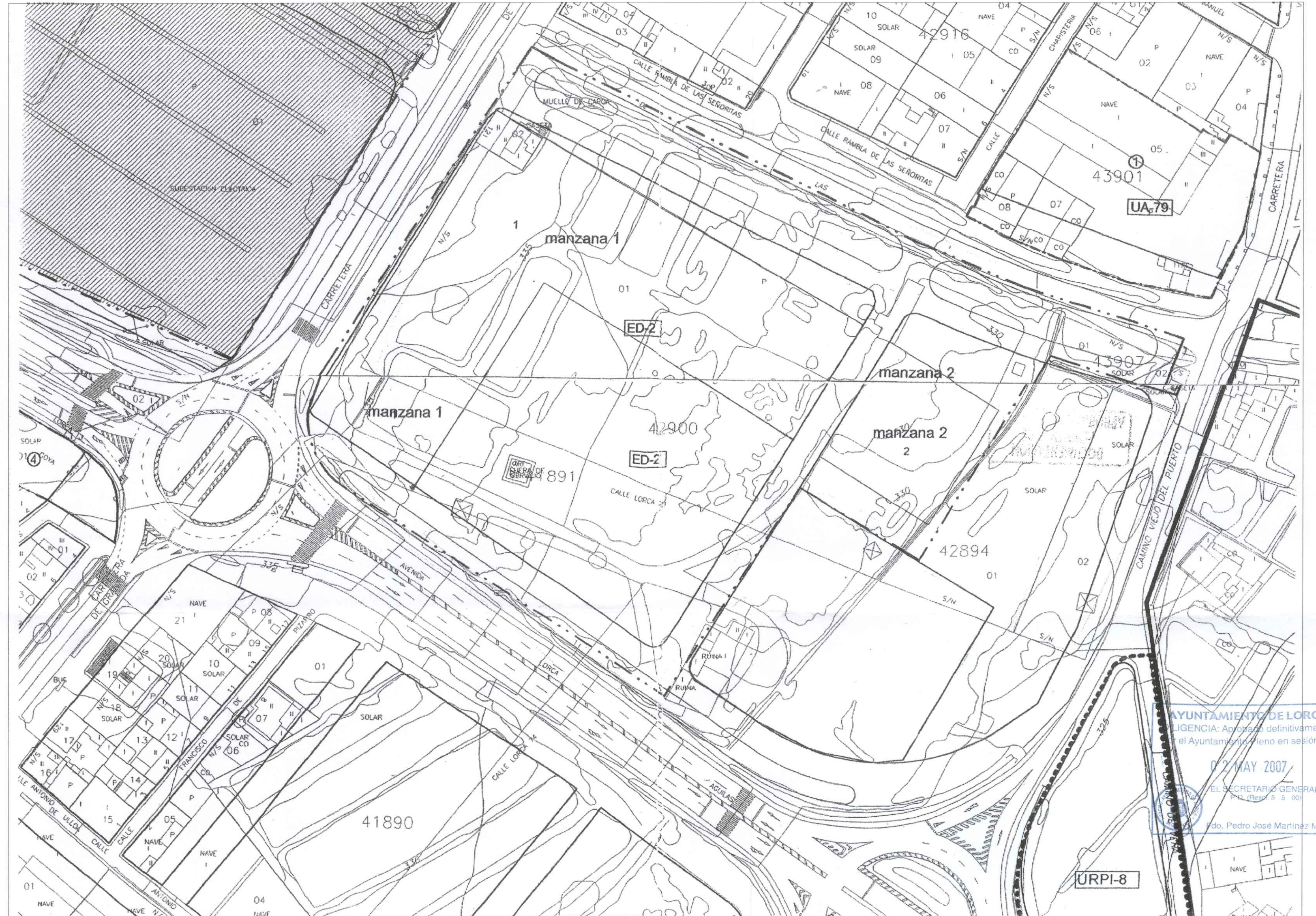
ZONIFICACION, ALINEACIONES Y RED VIARIA ESCALA 1:1.000

Plan General Municipal de Ordenación de Lorca